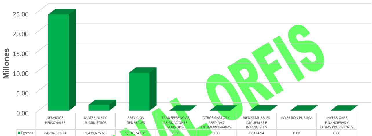
GRÁFICA 2 EGRESOS